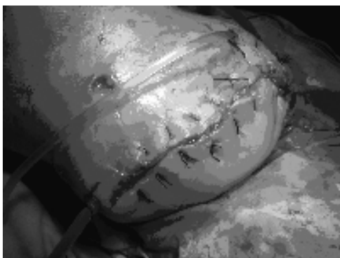
图 3 皮肤牵张后 12 d 缝合创面