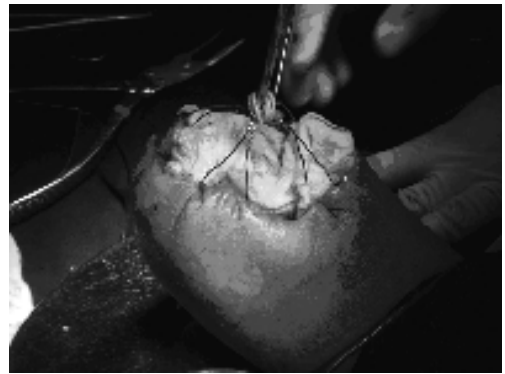
图 5 安置皮肤牵张器