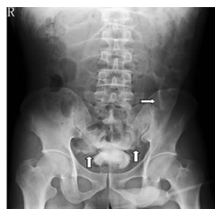
图 1 腹膜内型膀胱破裂

其中腹膜内破裂 4 例,腹膜外破裂 5 例,混合型破裂 4 例。随后追加 150 mL 造影剂后,在注入 250 mL 造影剂时无造影剂外溢的 5 例患者中,有 2 例发现造影剂外溢,2 例均为腹膜外膀胱破裂。延迟 10 min 后拍摄膀胱正位及左右斜位片,另外 3 例无造影剂外溢的患者中,有 1 例发现造影剂外溢,为腹膜外型膀胱破裂。2 例未发现造影剂外溢。在本组患者中,腹膜内膀胱破裂 5 例,典型病例见图 1,膀胱造影表现为造影剂进入腹腔,聚集于结肠旁沟、肠袢间,造影剂勾画出腹腔下缘及肠道的边缘。腹膜外膀胱破裂 9 例,典型病例见图 2,膀胱造影表现为:造影剂外溢呈条纹状或斑片状,位于膀胱下方或周围,形态固定不变。混合型膀胱破裂 4 例,典型病例见图 2、3,膀胱造影表现为:造影剂同时进入腹腔内与腹膜外。