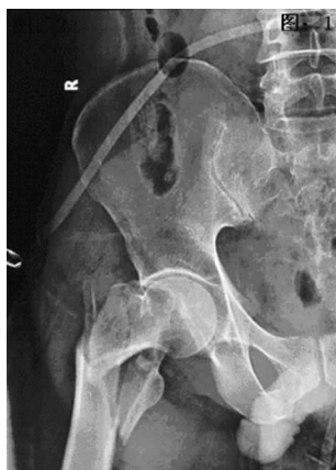
图 1 术前正位 X 线片

1.1 一般资料 2003 年 1 月至 2010 年 8 月本科收治股骨粗隆间骨折 66 例,男 37 例,女 29 例。年龄 54~86 岁。致伤原因:交通伤 32 例,坠跌伤 34 例。骨折按 Evan's 分型:Ⅱ型骨折 26 例,Ⅲ型骨折 21 例,Ⅳ型骨折 19 例。合并伤:脏器损伤 6 例,多发性骨折 8 例,高龄患者伴糖尿病 9 例,脑梗死 5 例,高血压 12 例。手术时间:伤后 4~9 d。