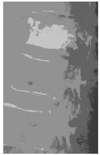
图 4 术后 X 线侧位片