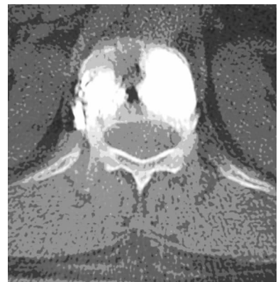
图 5 术后 CT 片