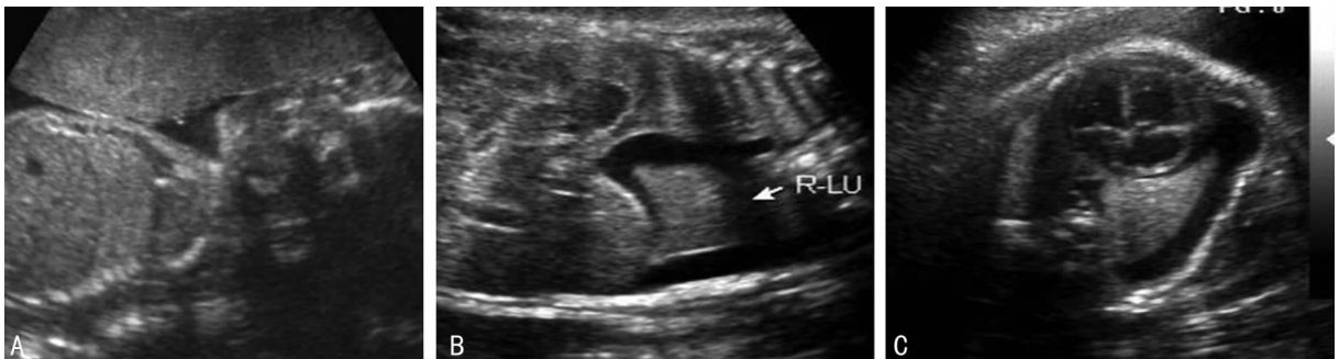
A:25 周孕右肺部未见异常;B,C:31 周孕右侧胸腔积液。