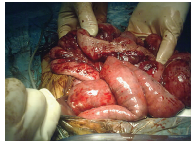
图 3 术中肠壁表面大体观察