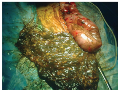
图 2 术中胃及小肠大体观察