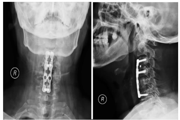
图 2 患者术后 X 片

后左上肢麻木及颈部疼痛较术前明显缓解, JOA 评分: 16 分。但术后第 1 天出现伸舌右偏、语言含糊、吞咽困难。查体: 言语稍含糊, 对答切题, 额纹对称, 伸舌偏右, 舌肌右侧萎缩, 四肢肌力可。考虑术中牵拉致右侧周围舌下神经损伤, 予以甲钴胺、高压氧等对症治疗, 术后 1 个月患者舌肌偏瘫、语言含糊、吞咽困难较前有所好转, 术后 3 个月完全恢复正常, 见图 3。