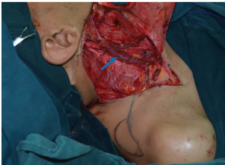
蓝色箭头：示颈外静脉；黄色箭头：示颈横静脉汇入颈外静脉

1.2.2 皮瓣设计和制备 在设计颈部淋巴结清扫切口时，同时设计上斜方肌肌皮瓣，皮瓣的血管蒂长度应能到达舌缺损与口底缺损交界处。通常以位于斜方肌后缘 3~5 cm 为宜，设计以颈横动脉为蒂的上斜方肌肌皮瓣。根据缺损大小制备皮瓣，以不超过缺损大小 2 mm 为宜；过大会显臃肿，过小会组织量不足。皮瓣制备后通常可潜行分离后直接拉拢缝合。皮瓣制备是在行根治性颈淋巴结清扫术中保留颈外静脉的前提下，解剖和处理颈内静脉近心端后，行锁骨上三角清扫时于椎前筋膜的浅面寻找并仔细解剖颈横动静脉，沿血管束线结扎其分支，向远心端分离至血管进入斜方肌处(图 1)。若术中颈横静脉汇入颈内静脉应在汇入处上端切断并结扎颈内静脉，以保证静脉回流和血管蒂的长度。血管束应适当保留一些周围组织形成血管蒂，尤其是进入斜方肌处。