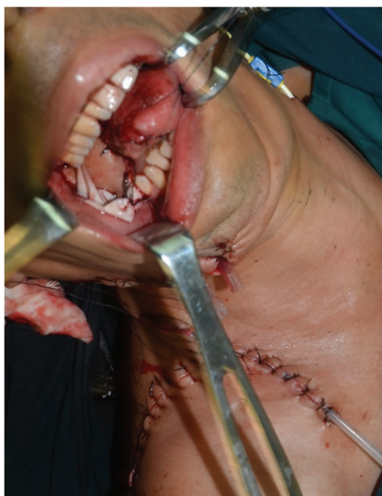
图 4 上斜方肌肌皮瓣转移至口腔内修复舌缺损