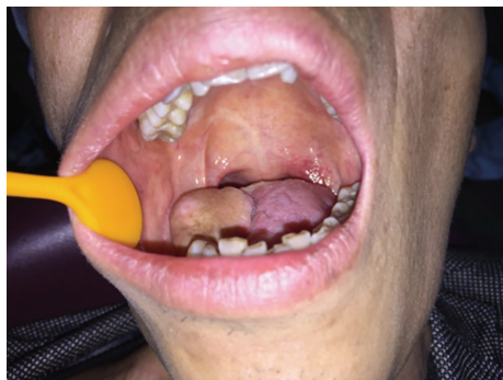
图 5 上斜方肌肌皮瓣修复舌癌术后缺损 2 年