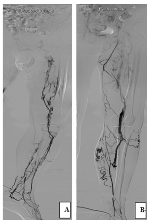
A: 观察组下肢深静脉造影; B: 对照组深静脉造影。