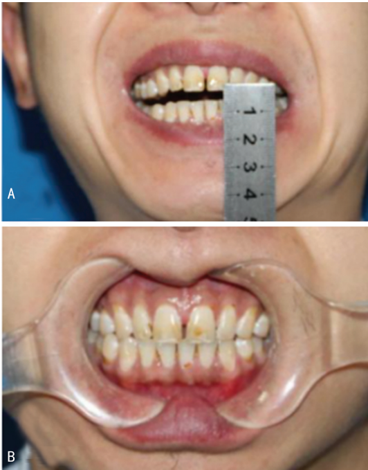
A: 开口度约 0.5 cm;B: 咬合关系正常。

显,提示左翼外肌及翼内肌异位骨化改变,见图 2。初步诊断:左侧翼内、外肌异位骨化。