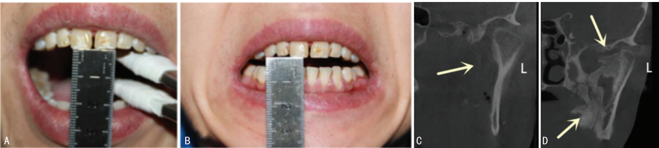
A:术后 3 个月被动张口度约 2.0 cm;B:术后 6 个月主动张口度约 0.4 cm;C:术后 7 d 冠状位 CBCT;D:术后 6 个月冠状位 CBCT;箭头:病变处。 图 4 术后随访情况

MOT 又称外伤性骨化性肌炎、局限性骨化性肌炎,其特征是在急性或慢性创伤、烧伤或外科手术后肌肉和其他软组织异位钙化,是一种获得性的异位骨化疾病 [3] 。笔者查阅相关文献,发现从 2000 年至今共报道 6 例同时累及翼内肌、翼外肌 MOT 的病例 [4-9] ,且国内无此类报道。 MOT 发病机制尚不完全清楚,目前最被接受的是 CAREY 在 1924 年提出的 4 个假设:(1)外伤使骨碎片移位进入软组织内,引发骨增生形成;(2)骨膜碎片向邻近软组织转移致使骨祖细胞增殖,引发骨增生形成;(3)外伤后骨膜穿孔致骨膜下骨祖细胞向周围软组织迁移,继发骨增生形成;(4)创伤使骨碎片溶解并释放出骨形态蛋白,骨形态蛋白化生后对软组织骨化产生影响。 影像学资料对术前诊断起了非常重要的辅助作用。BOFFANO 等 [10] 总结了 16 例 MOT 病例的 CT 影像学特点,其特征表现为一种骨化的高密度团块,呈带状,病损边界清晰,且病变从中心到周围密度增高。