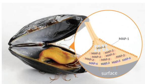
图1 贻贝 MAP 亚类